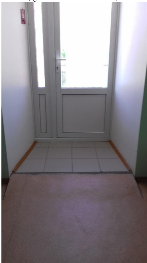
Пандус в спальном помещении